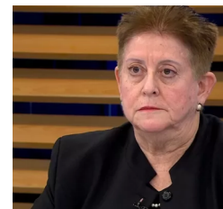
Golpe por golpe y diente p