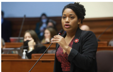
No entiende qué es el fascismo , pero el día que se lo expliquen puede que se eche a llorar