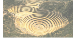
PERÚ- País de los Incas