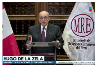
El Triste papel de Torre Tagle

Tampoco acepta que la calificación del asilo la hace el país que asila y no el que persigue, porque obviamente quién persigue nunca va a reconocer que lo hace por motivos políticos. El Derecho autoriza entonces a los gobiernos a intervenir, cuando a su juicio hay persecución política.