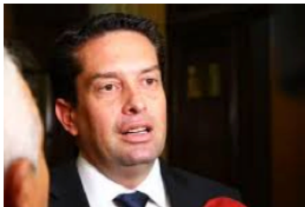
En el nombre del padre, y del hijo y de la interpretación a mi gusto