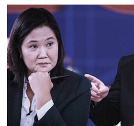
A la virgen rezando y con engordando