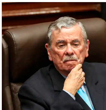
Confesó haber pedido apoyo a la Embajada de Estados Unidos para impedir el triunfo de Ollanta Humala

Lo estamos viendo maquinar moción tras moción, ley tras ley, para que todos los opositores políticos sean desactivados, impedidos de postular por el JNE, inhabilitados políticamente por el Congreso, y en lo posible reclusos en las cárceles. En la lista de espera están Pedro Castillo, Betsy Chávez, Roberto Sánchez y cualquier otro que ponga en riesgo el poder de la dinastía neoliberal que se mantiene desde 1990. Rospigliosi, es por todo eso, sin ánimo premeditado, un verdadero hijo de puta, una abominable excrecencia de la política peruana que la derecha alimenta todos estos años.