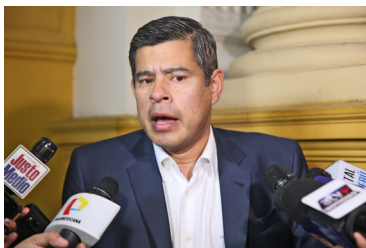
No es gemelo de Rospigliosi !pero se le parece tanto !