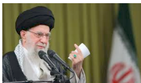
Sayyed Ali Khamenei, el gran líder de la revolución islámica que inició en 1979 Ruhollah Khomeini.

Sólo que el tantas veces pacífico, tantas veces engañado y tantas veces agredido sin motivo, pueblo sabio y milenario, por otra parte, el Iran que comanda Alí Jamenei como líder supremo, no está dispuesto a rendirse ante los misiles y aviones furtivos que prepara USA.