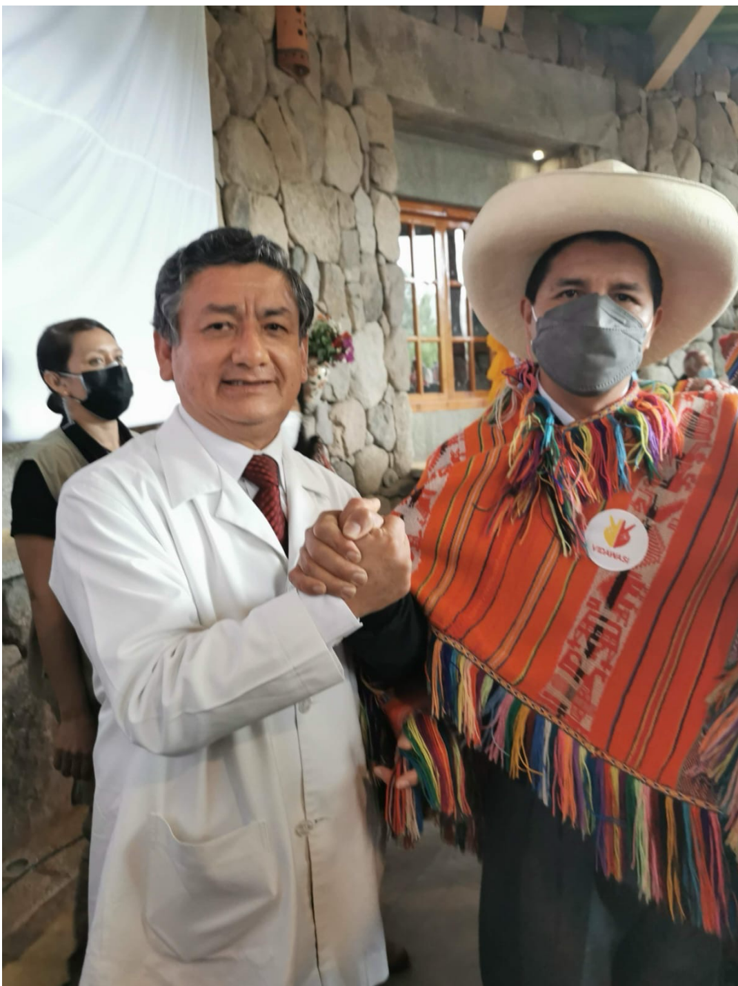
Con el Presidente Pedro Castillo

Por eso creo que la población donde voy me escucha y me da la razón porque la mayoría sufre. El asegurado en Essalud sufre las citas prolongadas, sufren de que no hay medicamentos, sufre los traslados, las manipulaciones y los costos excesivos en la parte privada. La salud es derecho de todos y hay que protegerla como primera prioridad.