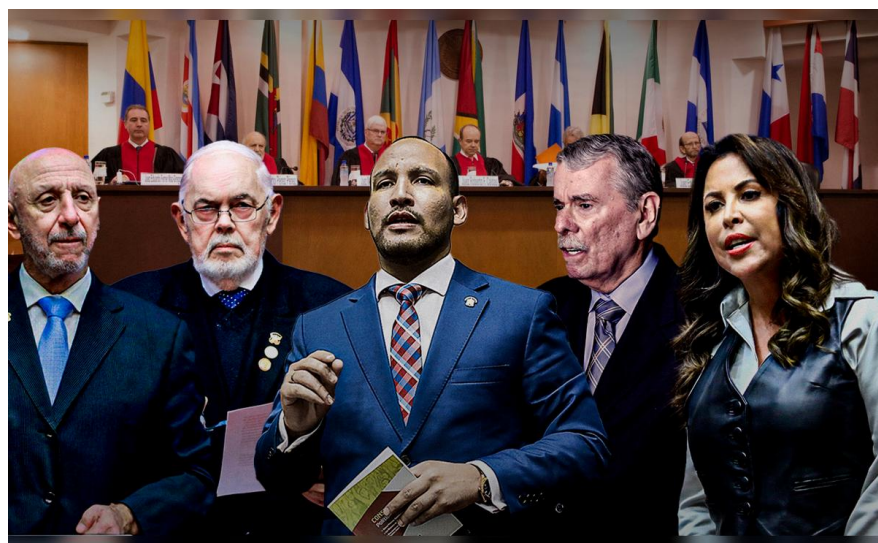
Infaltables atacantes de Venezuela. Chacales del imperio

Ni don Quijote tenía estos delirios. ¿En qué se basaron los congresistas para tomar esa insólita moción? Imposible saberlo. Pudo ser por ignorancia injustificable, por escuchar las mentiras que elabora