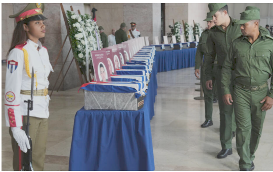
Honor y gloria a los caídos en combate

El ataque perverso contra Caracas y los estados de Aranda, Miranda y La Guaira, y el malhadado secuestro del Presidente Nicolás Maduro y su esposa Cilia Flores, aplasta principios civilizatorios incontestables de la relación entre países, entre ellos los siguientes: