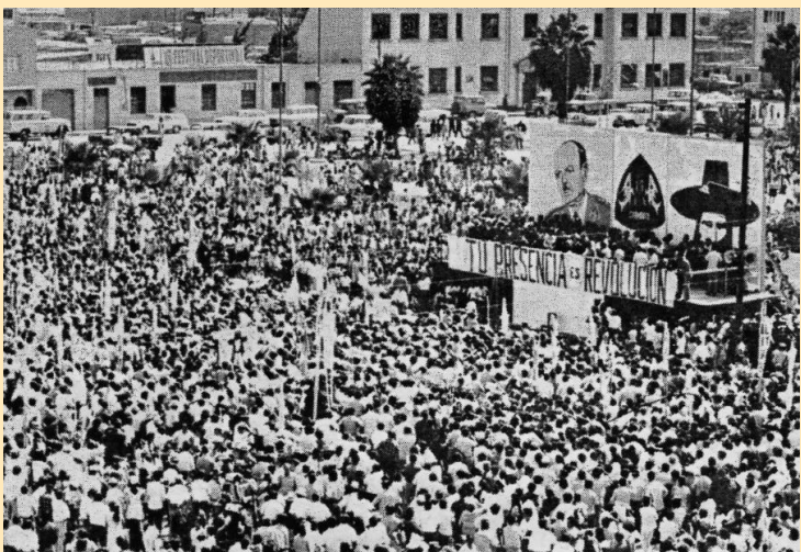
El gran triunfo del neo liberalismo fue dejar a la gran masa laboral sin empleo estable, y legalizar la división en los sindicatos. Deshacer todos los derechos que el velasquismo y los gobiernos anteriores habían conquistado.

El neoliberalismo dejó sin empleo a la gran masa de trabajadores, y las dirigencias laborales fueron incapaces de mantener unidas a las organizaciones sindicales. Es decir, mandaron al diablo el principal principio del sindicalismo: El Frente Único de Clase.