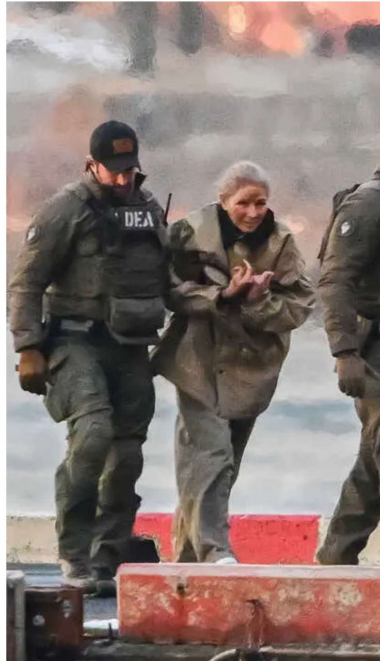
berbia y estulticia.

Donald Trump no ha podido comportarse hasta el momento como debe hacerlo el Presidente de una nación. Imposible compararlo en sensatez con Vladimir Putin o Xi Jinping, por ejemplo. Actúa cada vez más como un corsario facineroso que se pasea por el mundo haciendo alarde de su fuerza, pleno de so-