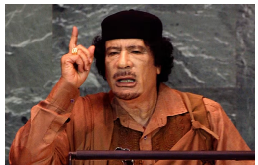
Gadafi, otra de las víctimas de la ambición imperialista