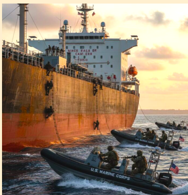
El momento del abordaje pirata

La noticia fresca que llega del imperio es la “incautación” de un barco petrolero por la marina norteamericana, frente a las costas de Venezuela. Trump ha dicho de eso que se trata de un petrolero muy grande, “el más grande que se haya visto nunca”. Preguntado sobre qué pasará con el petróleo del barco, Trump respondió “seguramente nos quedaremos con él”. Es el reconocimiento cínico de un verdadero acto de piratería contra Venezuela con el único sustento de la prepotencia militar y el descaro con que el gobernante norteamericano se burla del derecho internacional. Con razón, el periódico Rusia Today titula el evento, “Trump entra en modo robo”.