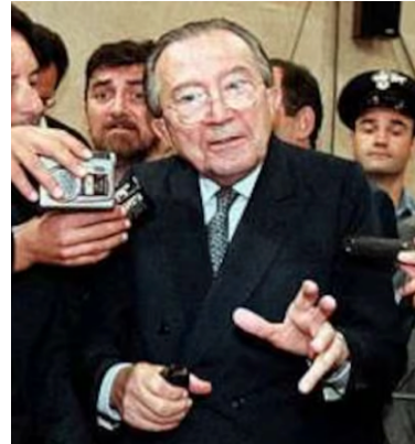
Giulio Andreotti, ex primer ministro italiano. Confesó en juicio quiénes estuvieron detrás del terrorismo de las “Brigadas Rojas”

La red “gladio” se fundó hace 69 años el 26/11/1956. Durante décadas fue tratada como una teoría conspirativa hasta que la evidencia obligó a reescribir los libros de historia de la guerra fría. El 24 de julio de 1990, Julio Andreotti primer ministro italiano, acorralado por las investigaciones judiciales reconoció la existencia de una estructura de información respuesta y salvaguarda, la red “gladio”.