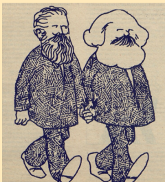
Un fantasma vuelve a recorrer el mundo

Las generaciones de los últimos 30 años conocen del comunismo por lo que han dicho de él sus adversarios. Es tiempo de que los comunistas cuenten su verdad.